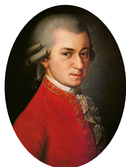
Wolfgang Amadeus Mozart